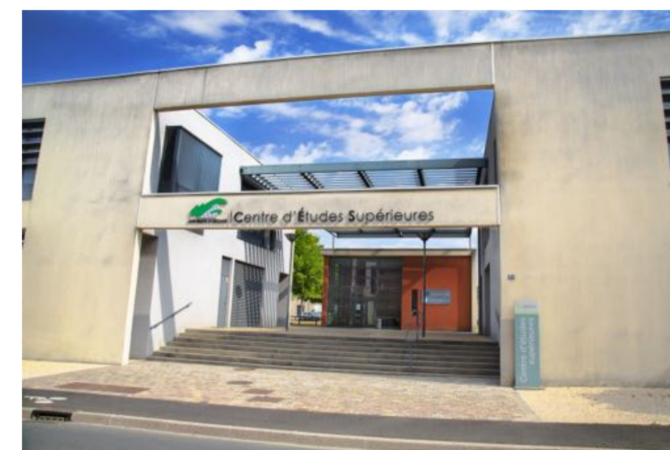
CES Orléans - 2007 Droit, Gestion, Histoire, LEA