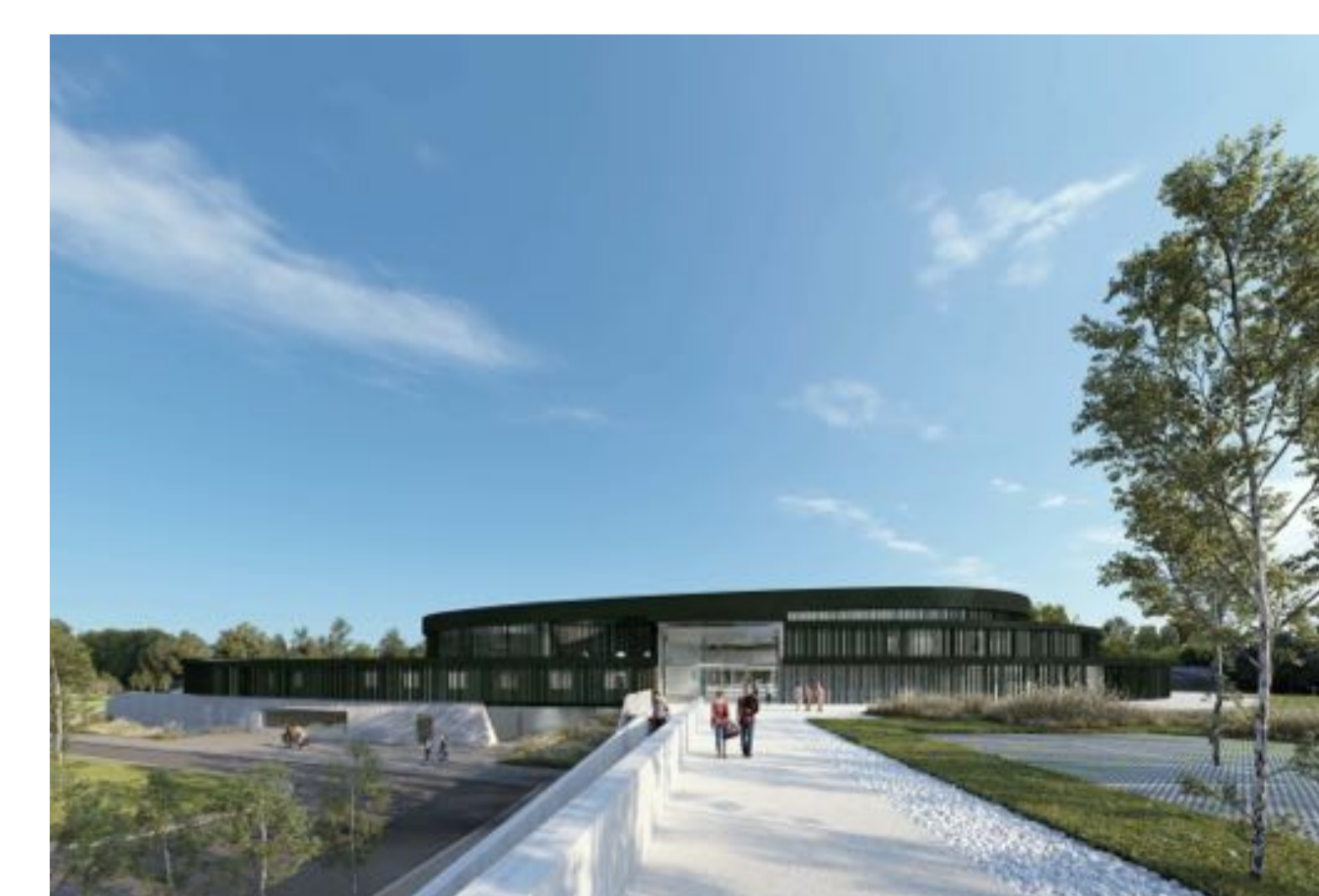
Centre Aquatique BALSANeo

Pour plus d'informations, les actualités et les sources scanner le QR code