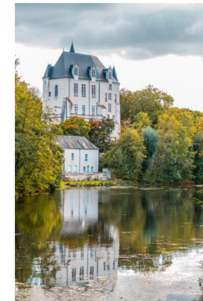
Château Raoul XII ème Siècle