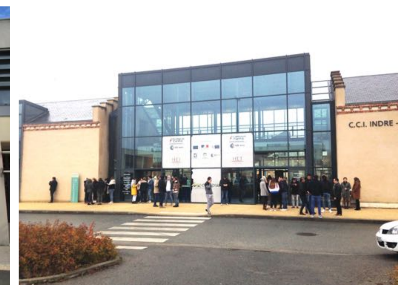
HEI-Centre - 2013 Ing RS en robotique