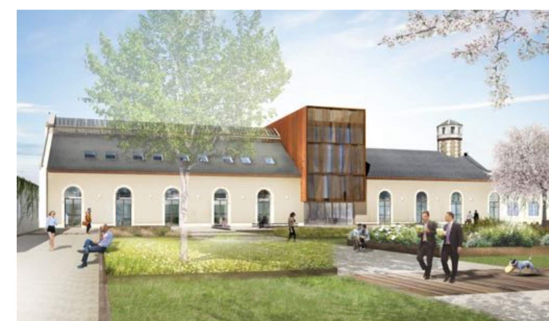
Cité du Numérique - Inauguration en 2020