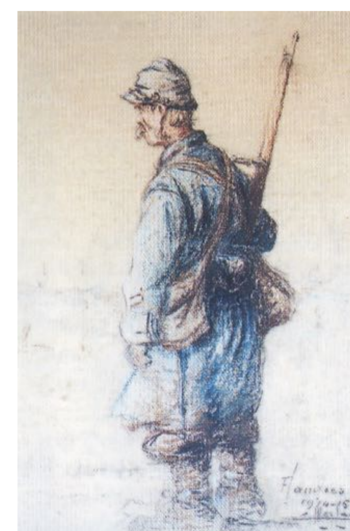
Uniforme "Bleu Horizon" 1914