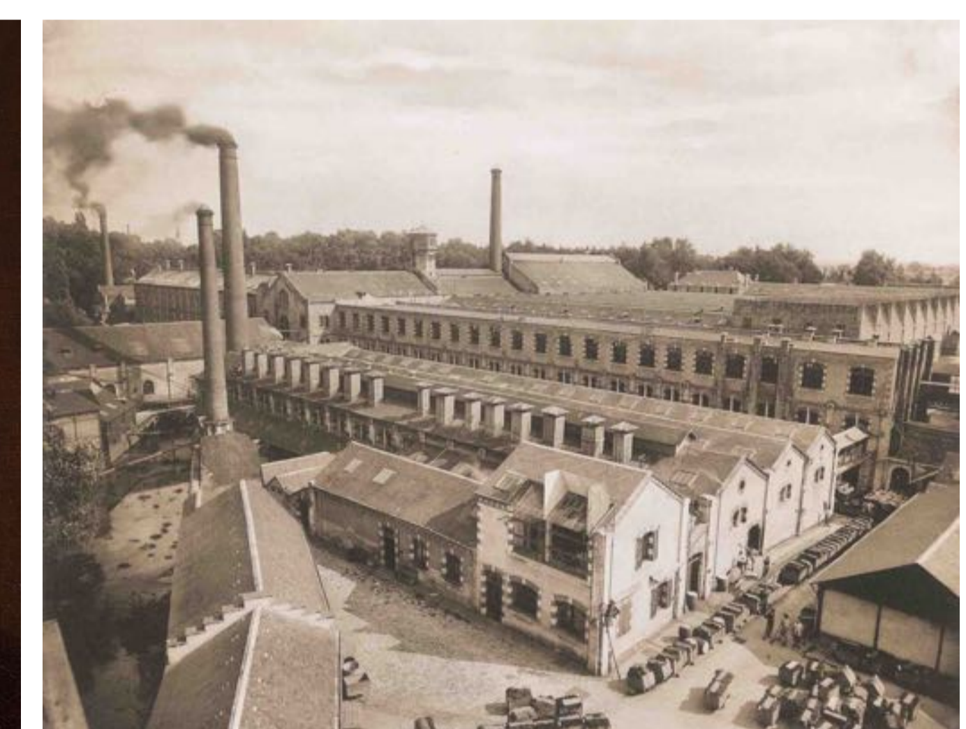
Manufacture BALSAN construite en 1862-69