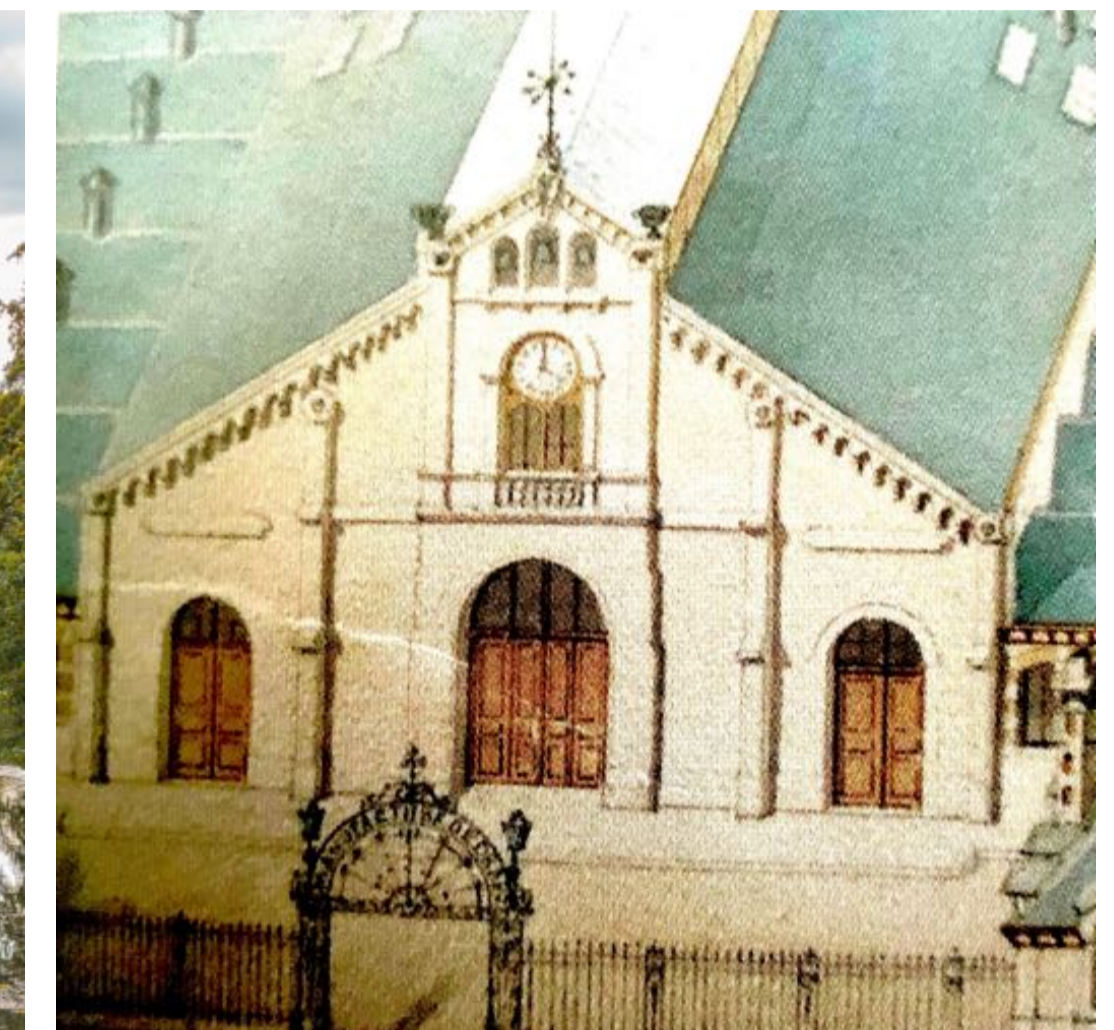
Manufacture, Aquarelle d'Alfred DAUVERGNE, 1860